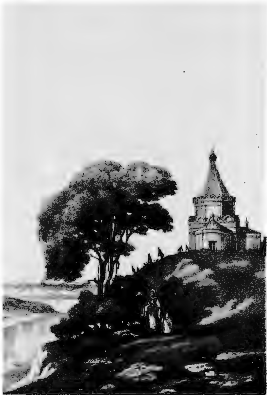
ВИДЪ ЦЕРКВИ ВЪ СЕЛѢ СПАСКОМЪ.